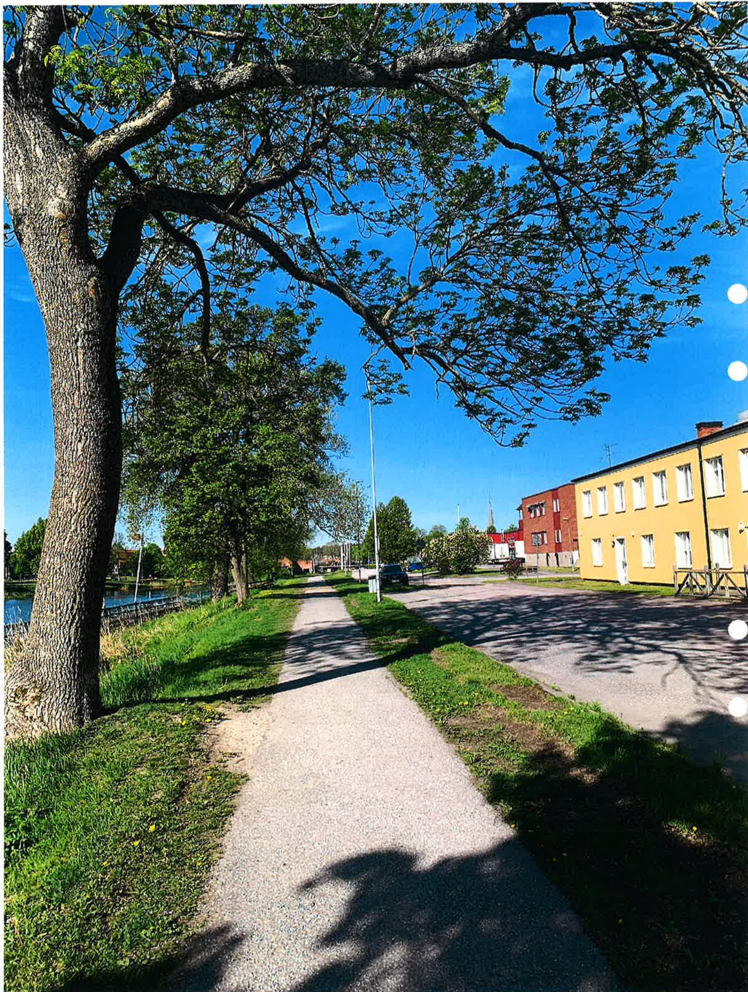
NORRA ÅGATAN, MED ARBOGÅN TILL VÄNSTER. BÅTPLATS LÄNGRE BORT.