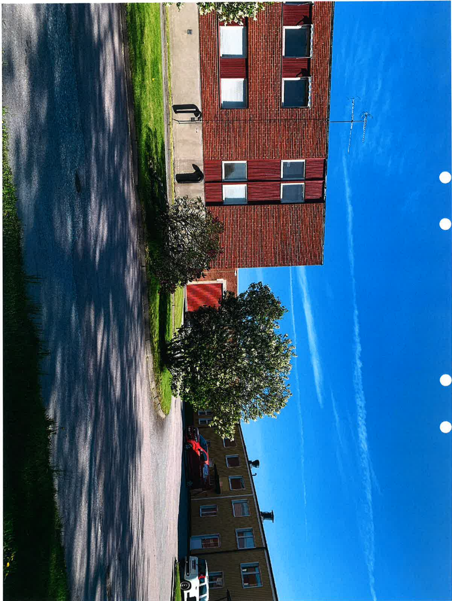
NORRA ÄGATAN MED TEGELBYGGNADEN TILL VÄNSTER.